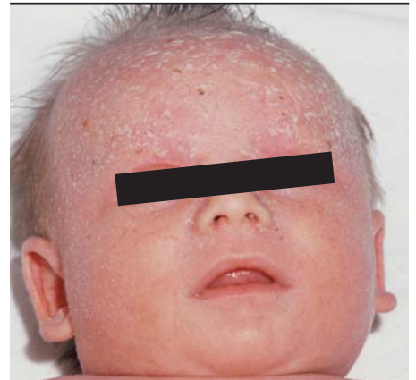
Obrázok 2. Dermatitis seborrhoica.

môže byť prítomné aj mokvanie a tvorba krúst. Vo väčšine prípadov seboreická dermatitída dojčiat spontánne ustúpi. Len veľmi zriedkavo sa u malých detí vyvíja generalizovaná forma seboreickej dermatitídy pod obrazom exfoliatívnej erythrodermie ( erythrodermia desquamativa Leiner ), spojenej s hnačkami, rekurentnými infekciami a lymfadenopatiou. Príčinou býva najčastejšie niektorý z primárnych imunodeficientných stavov.