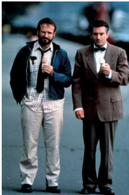
Obr. 7. Robin Williams a Robert de Niro ve filmu Awakenings (1990)

nou provozovaných řádem Little Sisters of the Poor .