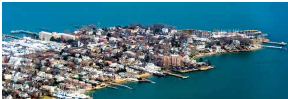
Obr. 3. City Island v newyorském Bronxu, bydliště Olivera Sackse po většinu jeho života

konával usilovným plaváním ve vodách kolem ostrova (uplavával až 6 námořních mil, tj. skoro 10 kilometrů, denně), tento zvyk mu vydržel až do konce života (Lees, 2015).