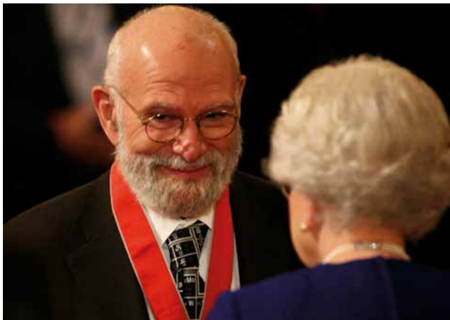
Obr. 1. Oliver Sacks přebírá Řád komandéra britského impéria (CBE) od královny Alžběty, Buckinghamský palác, 14. června 2008

V roce 1961 přesídlil do Kalifornie a pokračoval v rezidentuře v nemocnici Mount Zion v San Franciscu, asi po roce se přesunul do neuropatologické laboratoře UCLA v Los Angeles, kde se věnoval výzkumu v této oblasti, a to poměrně úspěšně (Sacks, 1965; Sacks, 1966a, b). V Kalifornii také mohl konečně věnovat dostatek času svým dvěma tehdejšími hlavními koníčkům: motorkářství a vzpírání. Stal se členem motorkářského gangu, se kterým podnikal dlouhé výlety, např. noční trip ke Grand Canyonu a zpět, celkem 1000 mil (Lees, 2015). Stal se pravidelným návštěvníkem Muscle