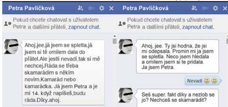
Obrázek 2. Ukázka navázání kontaktu s dítětem v prostředí Facebooku (skutečný případ a jméno fiktivní)