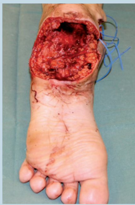
Obrázok 4. Stav po resekcii dekubitu päty.