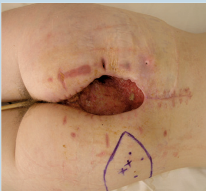
Obrázok 1. Sakrálny dekubit po neúspešnej resutúre.