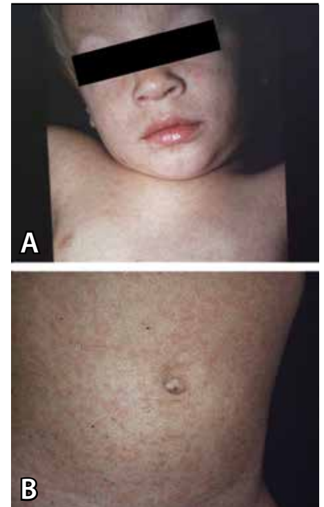
Obrázok 1A a 1B. Postvakačný syndróm po Trimovax vakcinácii (15-mesačné dieťa). (Všetky foto sú z pracoviska autorky).

dostupné sú prejavy lymfadenitídy na processus mastoideus (Theodorova žľaza). Pozoruje sa aj zväčšená slezina. U dospelých môže rubeola prebiehať ako latentné alebo inaparentné infekčné ochorenie (5). Ako komplikácia ochorenia sa zriedkavo pozoruje trombocytopenia s prejavmi trombocytopenickej purpury, raritne vyúsťujúca až do hemoragického syndrómu. Rovnako veľmi zriedkavo je vírusová encefalitída. U adolescentov a dospelých sa ako komplikácia rubeoly nezriedka pozoruje artritída. Primárna vírusová infekcia je vážnou komplikáciou gravidity. Až v 90 % prípadov dochádza v prvých 11 týždňoch tehotnosti k viacorgánovému poškodeniu plodu. Všeobecne platí, že čím skôr dôjde k infikovaniu gravidnej ženy, tým je nebezpečenstvo embryopatie väčšie. Poškodenie srdca a očí je najčastejšie počas prvých 6 týždňov, hluchota a mentálna retardácia s mikrocefáliou nastávajú