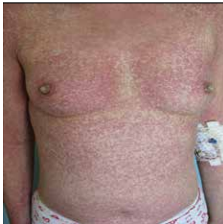
Obrázok 3. Toxický šokový syndróm (TSS) u dospeljej pacientky

grujúci charakter. V priebehu dňa mení intenzitu. Rovnako sa zväzňuje aj po pobyte v teple, na slnku, alebo po okúpaní. Ustupuje do 10 až 14 dní. Kĺbová symptomatológia je u detí raritná. Je potrebné zdôrazniť sezónnosť s výskytom jar – jeseň, ako aj častý výskyt v kolektívach, možný aj v malých epidémiách. Pri ochorení u gravidnej ženy sa môže vyskytovať anémia plodu, abort a hydrops fetalis (14). Transplacentárny prenos infekcie sa opisuje asi v 25 %, V porovnaní s rubeolou pri ochorení v gravidite sú následky na plod v menšom percente .