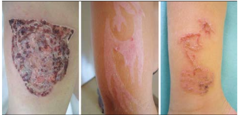
Obrázok 3. Rôzne štádiá a formy dermatitídy po prvej aplikácii tetovacie čiernou henou.

alergénmi (6, 14). V tabuľke 1 je názorný prehľad výskytu PPD a potenciálnych alergénov, s ktorými môže skřížene reagovať.