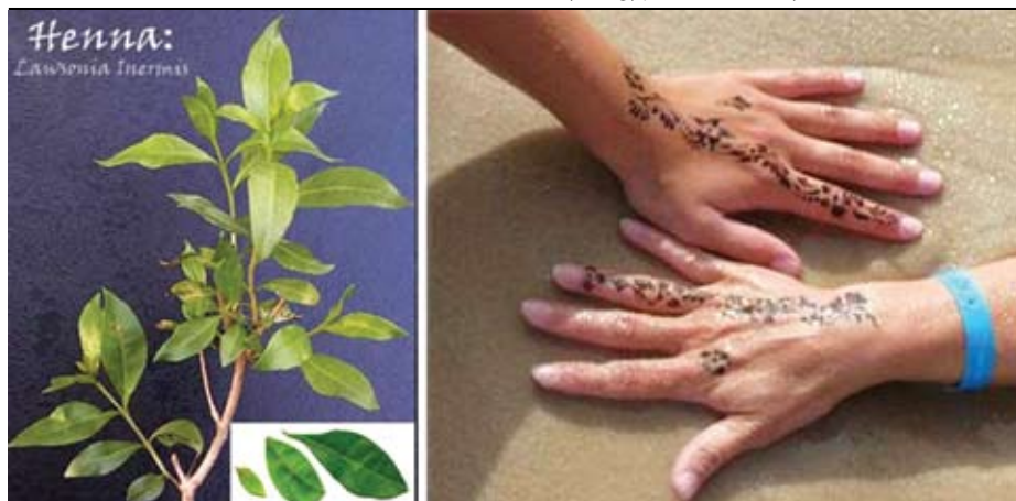
Obrázok 1. Hena, tetovanie čiernou henou z dovolenky v Egypte "henna body art".

Hena , lat. Lawsonia inermis (obrázok 1), je krík rastúci v subtrópech Severnej Afriky, na strednom